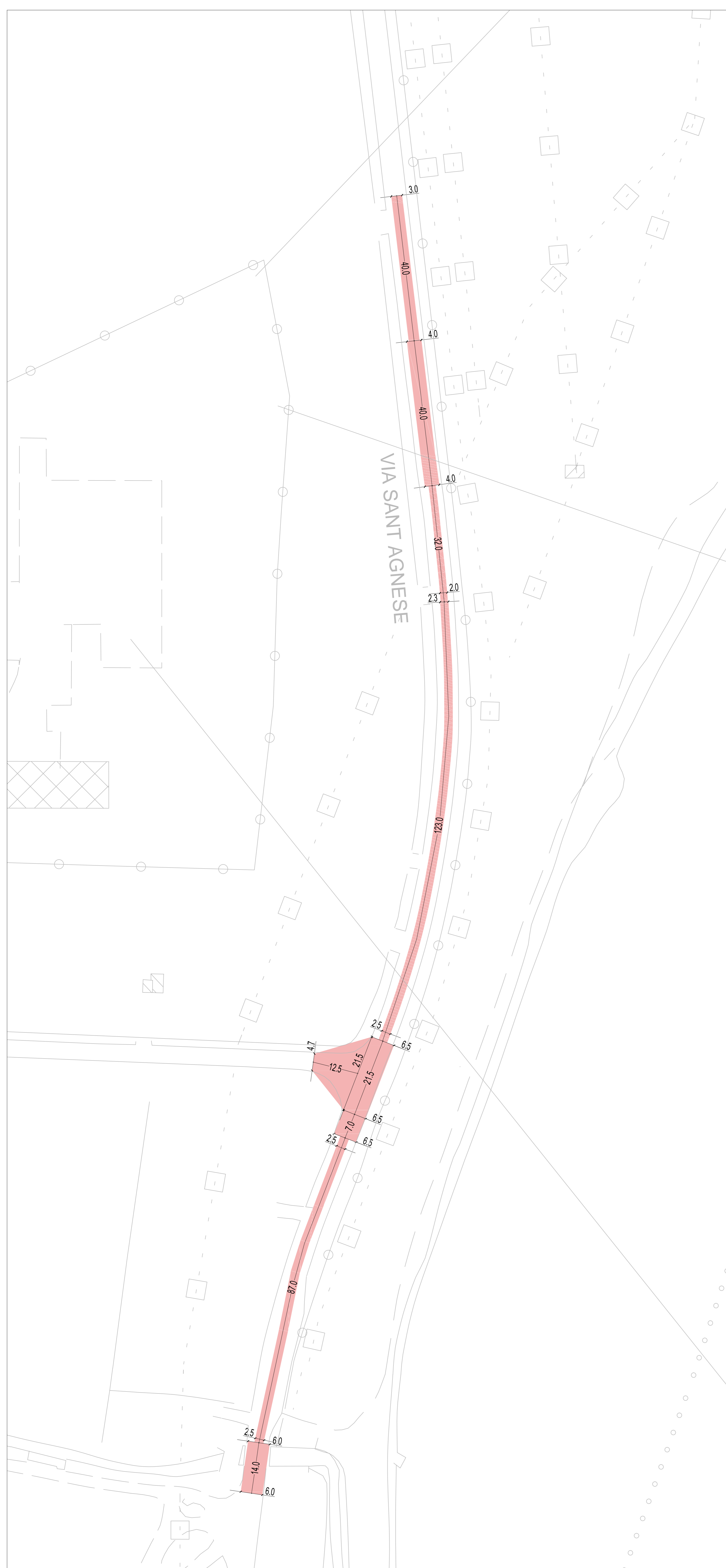
SCALA 1:500 QUALSO - VIA SANT AGNESE PARTE SUD