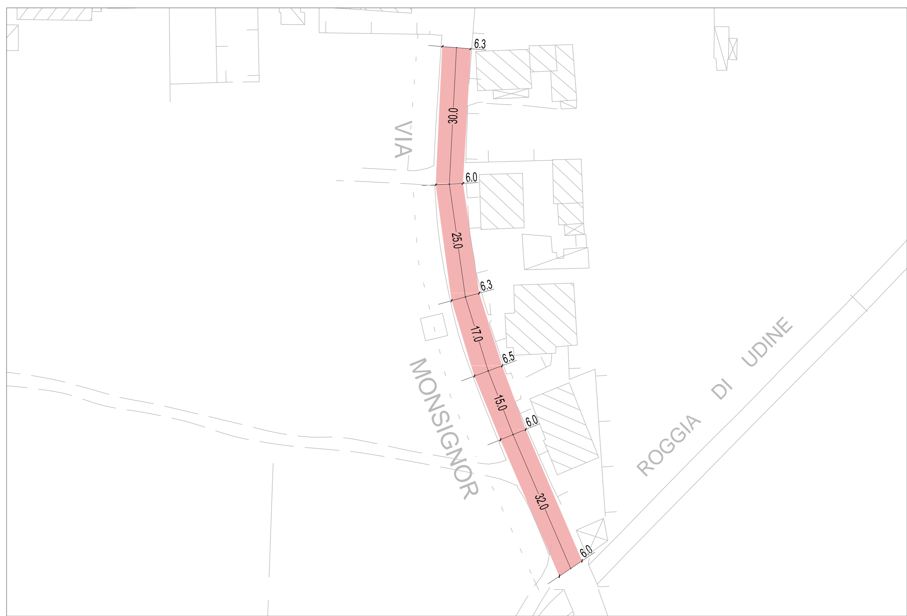
SCALA 1:500 ZOMPITTA - VIA MONSIGNOR PIGANI

N.B.: TUTTE LE QUOTE DOVRANNO ESSERE VERIFICATE IN CANTIERE DALL'IMPRESA O DALL'ASSUNTORE DEI LAVORI E SE IN CONTRASTO CON I DISEGNI ARCHITETTONICI INTERPELLARE LA DIREZIONE LAVORI. PER GLI SPESSORI DI SCARIFICAE DI SUCCESSIVA STESURA DEL TAPPETO E BINDER FARE RIFERIMENTO ALLE RELATIVE VOCI NEL COMPUTO METRICO.