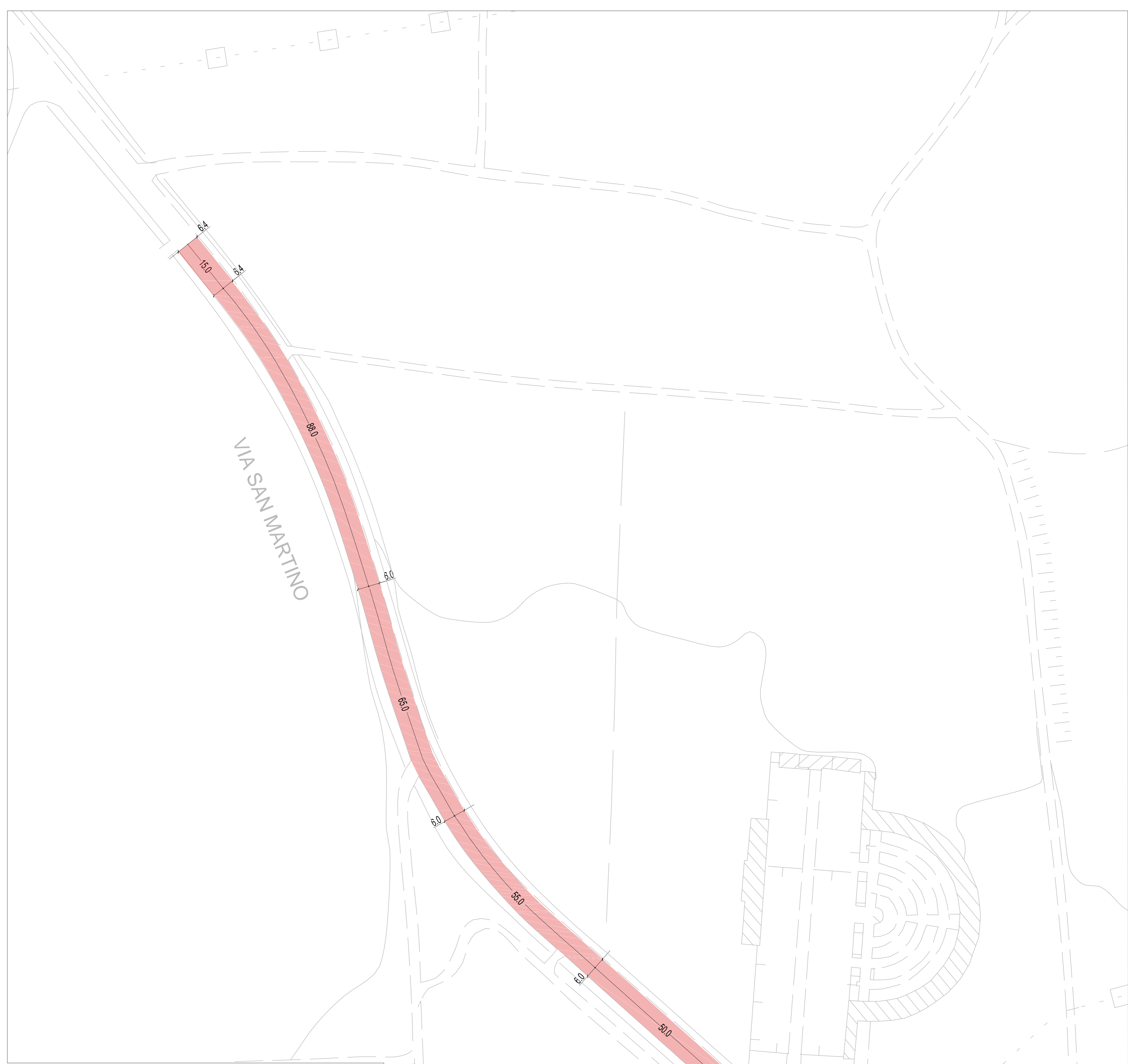
SCALA 1:500 ZOMPITTA - VIA SAN MARTINO